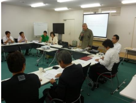
第1回ポジティブカフェ