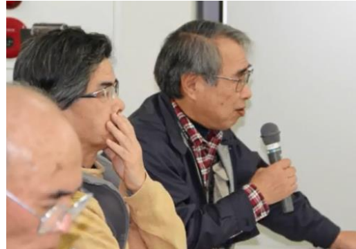
第2回ポジティブカフェ