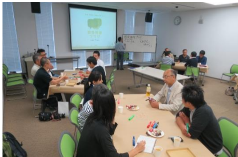
ポジティブカフェ@いわき