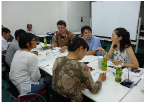
第1回ポジティブカフェ