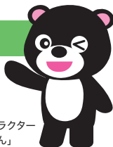
大熊町 マスコットキャラクター 「まあちゃん」

JR常磐線「大野駅」より生活循環バスで約15分 常磐自動車道「常盤富岡IC」より約7分、「大熊IC」から約10分